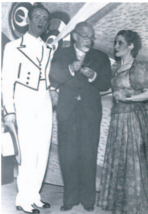
Miguel de Molina, Jacinto Benavente y Amalia de Isaura, a comienzos de los años cuarenta.

Fragmentos del artículo publicado en EL PAÍS Semanal , 5 / 6 / 1994